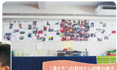
「凍々子」の栽培から収穫の様子、 調べたことをまとめ、校内に掲示