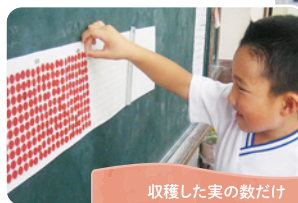
収穫した実の数だけ シールを貼る収穫表

観察記録をグラフに表すことで、植物の生長を明確に把握することができます。また、観察記録などを多くの人々の目につく場所に掲示し、周囲の人たちとの交流や意見交換をすることで、活動に広がりが生まれます。