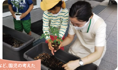
玄関や屋上など、園児の考えた 場所で比較栽培

学校・園内のどこで栽培するとトマトを上手に育てられるか考えてみましょう。実際に比較しながら育てる中で、どんな条件だとより大きく育つか、より多く収穫できるのかを知ることができ、自主性を育み、興味と学びを深められます。