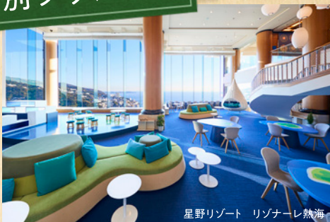
星野リゾート リゾナーレ熱海

KAGOMAIL(カゴメール)登録会員の皆さまに、星野リゾート(6施設)の特別プランをご案内しています。次回、11月14日(月)に配信するKAGOMAILにて、詳細をご案内いたします。カゴメールにご登録されていない方は、下記「 KAGOMAILのご登録方法 」に従って、 11月11日(金)まで にご登録ください。