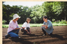
ファーマーズレッスン (イメージ)

日本初の「アグリーツーリズムリゾート」をコンセプトに、地域の生産活動に触れる体験や食事など、大自然の中でのリゾート滞在を提案しています。ホテル内にある農園「アグリガーデン」では、四季を通して様々な野菜やハーブを育てており、農作業体験やお子様と一緒に愉しめる食体験など、様々なアクティビティを準備しています。