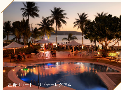
星野リゾート リゾナーレグアム