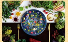
イノベティブな食体験

KAGOMAIL(カゴメール)登録会員のみなさまに、星野リゾート(8施設)の特別プランをご案内しています。次回11月15日(金)に配信するカゴメールにて、詳細をご案内します。カゴメールにご登録されていない方は、右記「KAGOMAILの登録方法」に従って11月14日(木)までにご登録ください。