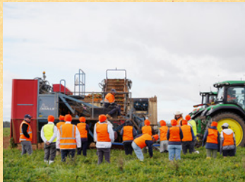
海外拠点見学ツアーの様子(オーストラリア)

当社は株主のみなさまにカゴメをより深く知っていただくため、定期的に株主さま限定イベントを開催しています。7月は昨年もお好評いただいたオーストラリアにあるカゴメの海外拠点の見学ツアー(有償)、8月は那須工場で5年ぶりに見学会を開催しました。国内外問わず、特別な体験・スタッフとの交流を通して、当社が大切にしている「畑は第一の工場」というモノづくりの考えをご説明しています。今後のイベント情報もKAGOMAIL(カゴメール)にてご案内いたしますので、お楽しみに!