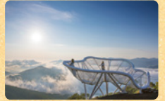
風景を活かした斬新な空間デザイン