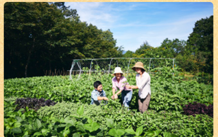
農業体験ができるリゾート リゾナーレ那須