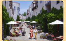
地域季節ならではのイベント