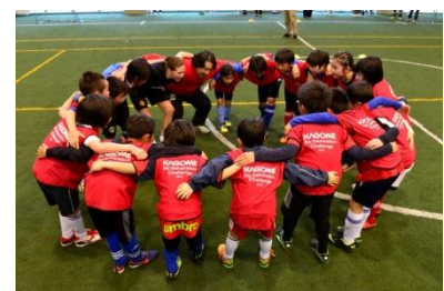
<昨年開催時の様子>