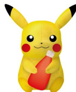
「ピカチュウぬいぐるみ」