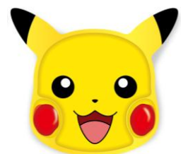
「ピカチュウオムライスプレート」