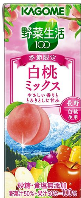
野菜生活100 白桃ミックス

カゴメは、日本各地の野菜や果実を使用した商品を展開することで、日本の農業を応援いたします。