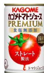
カゴメトマトジュースプレミアム 食塩無添加 160g ※8月21日(火)発売