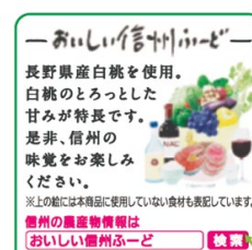
側面パッケージ3種