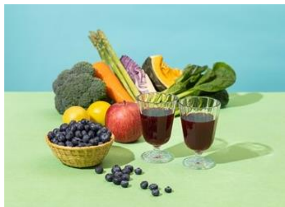
<野菜生活 100 岩手ブルーベリーミックス グラスカットイメージ>