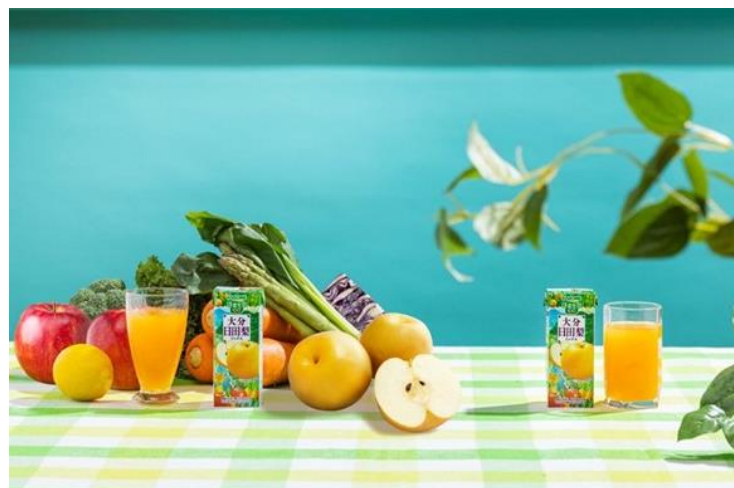
<「野菜生活 100 大分日田梨ミックス」グラスカットイメージ>