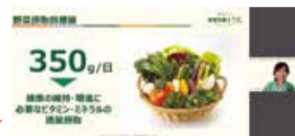
「健康セミナー」配信イメージ

「野菜と生活 管理栄養士ラポ®」より『野菜摂取でナトリウムバランスを整えよう!』をお届けします!