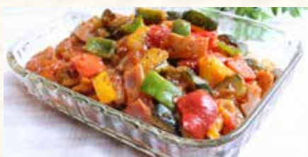
夏野菜のスパイスラタトゥイユ