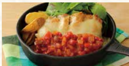
サルサチキン チーズ焼き