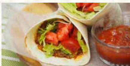
トマト味わうタコス