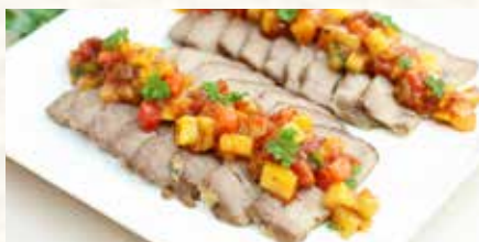
豚のロースト マンゴートマトサルサ