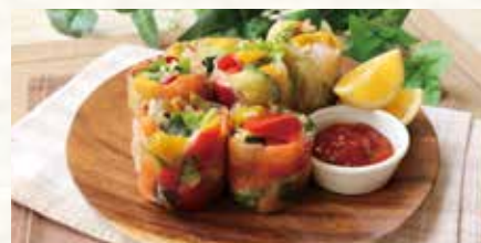
彩り野菜の生春巻き