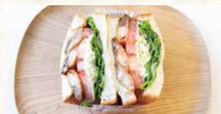
サバ竜田サルササンド