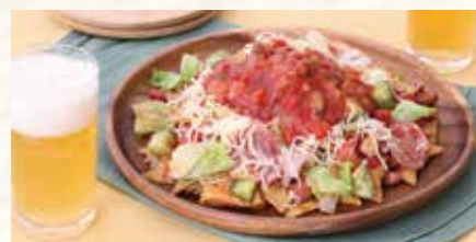
トルティーヤロコス(メキシコの屋台グルメ)