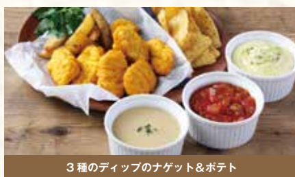
3種のディップのナゲット&ポテト