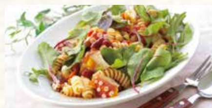
たこと彩り野菜のピリ辛パスタサラダ