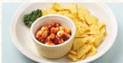
食べるサルサ〜トルティーヤチップス添え〜