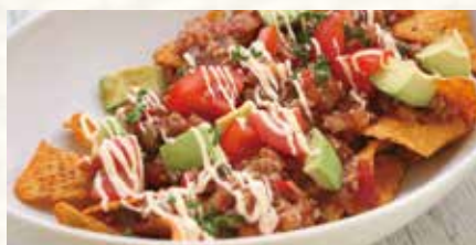
ビール進む! 辛旨タコス