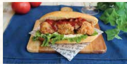
サルサでさっぱり ボリューム唐揚げサンド