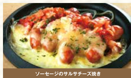
ソーセージのサルサチーズ焼き