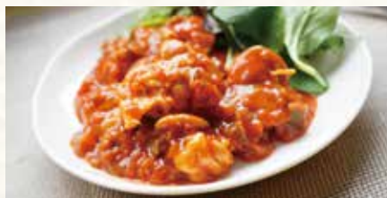
チキンのサルサ煮込み