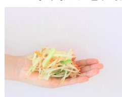
上段 左:サラダ 中央:ミネストローネ 右:野菜炒め