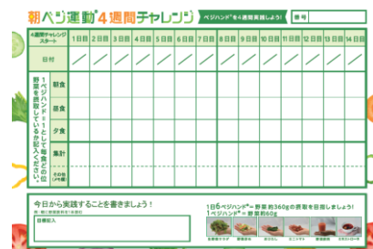
写真左:ベジチェック® / 写真中央:カゴメ野菜飲料 / 写真右:ベジハンド®レコーディングシート