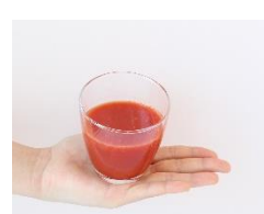
下段 左:ミニトマト 中央:おひたし 右:野菜ジュース