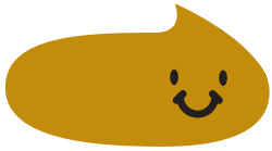
するっとでる、 いいうんち

うんちがでたら、どんなうんちかをチェックしよう！ でなかったら(でない)に○するしをしよう