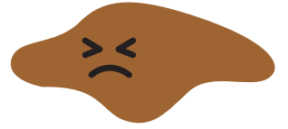
おなかがいたい、 げりうんち