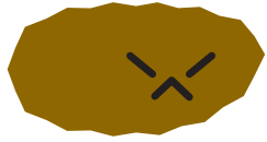
おしりがいたい、 かたいうんち